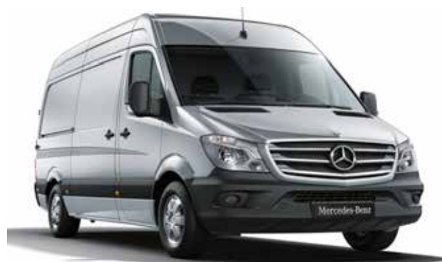
Sprinter Van, High Roof (D03), RL5 - Light-alloy wheels, 6.5 J x 16

Ηλεκτρονικό Πρόγραμμα Ευστάθειας ESP9i • Σύστημα πέδησης με ABS, ASR και EBV • Δισκόφρενα εμπρός-πίσω • Υποβοήθηση εμπρός-πίσω • Υποβοήθηση πέδησης (BAS) • Υποβοήθηση πλευρικών ανέμων (Standard, Long & Extra Long έως 3,88 tn) • Εφεδρικός τροχός • Φίλτρο σωματιδίων ντίζελ • Κιβώτιο 6 σχέσεων ECO Gear • Φίλτρο πετρελαίου • Συρόμενη πόρτα δεξιά • Πίσω πόρτες δύο φύλλων, με παράθυρο και καθαριστήρες • Διπλό κάθισμα συνοδηγού • Αερόσακος οδηγού • Υφασμα "Tunja" μαύρο • Ξύλινο δάπεδο χώρου φόρτωσης • Χώρισμα χώρου φόρτωσης με συρόμενο παράθυρο • Ρυθμιζ, κλιματισμός TEMPOMATIC • ASSYST υπολογιστής service • Κεντρικό κλειδί με ασύρματο τηλεχειριστήριο • Radio-CD MP3 με ηχεία 2 δρόμων • Εσωτερικός καθρέφτης • Immobilizer • Ηλεκτρικά παράθυρα • Πακέτο καπνιστού • Λασπωτήρες για εκδόσεις 4,6 και 5 τόνων μεικτού βάρους • Όχημα χαμηλών ρύπων Euro 6