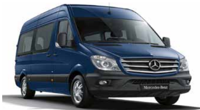
Sprinter CrewBus, High Roof (D03), RL7 - Light-alloy wheels, 6.5 J x 17

Ηλεκτρονικό Πρόγραμμα Ευστάθειας ESP9i • Σύστημα πέδησης με ABS, ASR και EBV • Δισκόφρενα εμπρός και πίσω • Υποβοήθηση πέδησης (BAS) • Υποβοήθηση πλευρικών ανέμων (Standard, Long & Extra Long έως 3,5 tn) • Εφεδρικός τροχός • Φίλτρο σωματιδίων ντίζελ • Κιβώτιο 6 σχέσεων ECO Gear • Ελαστικά 235/65 R16 • Ατσάλινες ζάντες • Φίλτρο πετρελαίου • Συρόμενη πόρτα δεξιά • Δίφυλλη πίσω πόρτα με παράθυρο και καθαριστήρες • Άβραφοι προφυλακτήρες • 9 θέσεις (3-3-3) • Αερόσακος οδηγού-συνοδηγών • Υφασμα "Tunja" μαύρο • Ρυθμιζ. κλιματισμός TEMPATIC και για τους πίσω επιβάτες • ASSYST υπολογιστής service • Κεντρικό κλειδί με ασύρματο τηλεχειριστήριο • Radio-CD MP3 με ηχεία 2 δρόμων • Immobilizer • Ηλεκτρικά παράθυρα εμπρός • Θερμαινόμενοι και Ηλεκτρικά ρυθμιζόμενοι εξωτερικοί καθρέπτες • Φώτα ημέρας αυτόματα • Προβολείς ομίχλης αλογόνου • Τιμόνι ρυθμιζόμενο σε κλίση και ύψος • Πρίζα 12V στο θάλαμο επιβατών • Πακέτο καπνιστού • Όχημα χαμηλών ρύπων Euro 6 Gr. I