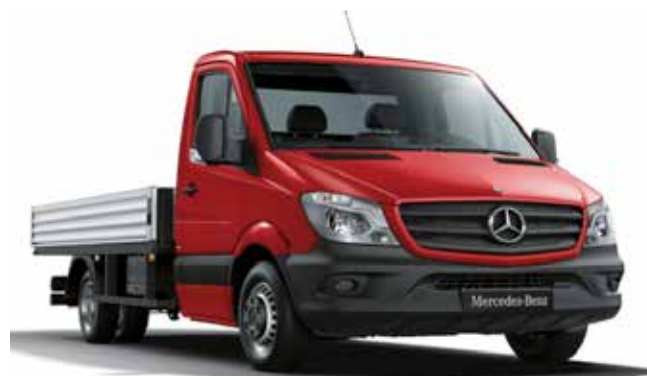
Sprinter Chassis, P02 - Steel platform with aluminium sideboards and tailboard

Ηλεκτρονικό Πρόγραμμα Ευστάθειας ESP9i • Σύστημα πέδησης με ABS, ASR και EBV • Διακόφρατα εμπρός και πίσω • Υποβοήθηση πέδησης (BAS) • Εφεδρικός τροχός • Φίλτρο σωματιδίων ντίζελ • Κιβώτιο 6 σχέσεων ECO Gear • Φίλτρο πετρελαίου • Διπλό κάθισμα συνοδηγού • Αερόσακος οδηγού • Υφασμα "Tunja" μαύρο • Ρύθμιζ. κλιματισμός TEMPOMATIC • ASSYST υπολογιστής service • Κεντρικό κλείδωμα με ασύρματο τηλεχειριστήριο • Radio-CD MP3 με ηχεία 2 δρόμων • Εσωτερικός καθρέφτης • Φώτα περιμέτρου αμαξώματος • Immobilizer • Ηλεκτρικά παράθυρα • Πακέτο καπνιστού • Όχημα χαμηλών ρύπων Euro 6